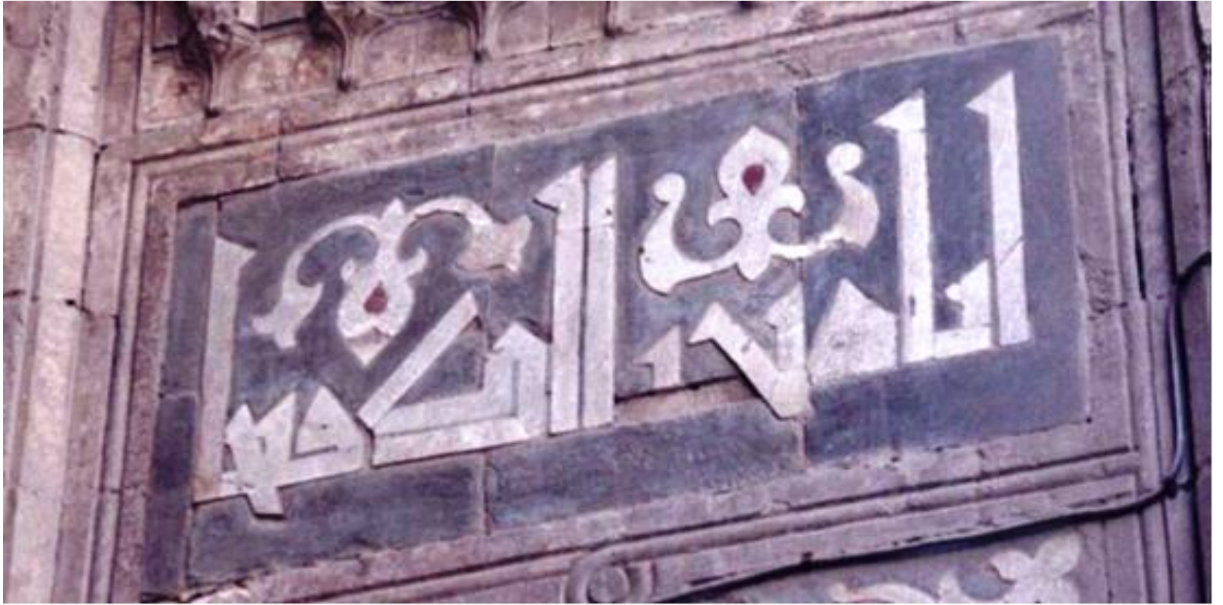
النقوش الكتابية الكوفية الموجودة على جانبي المدخل الرئيسي بمدرسة السلطان حسن .