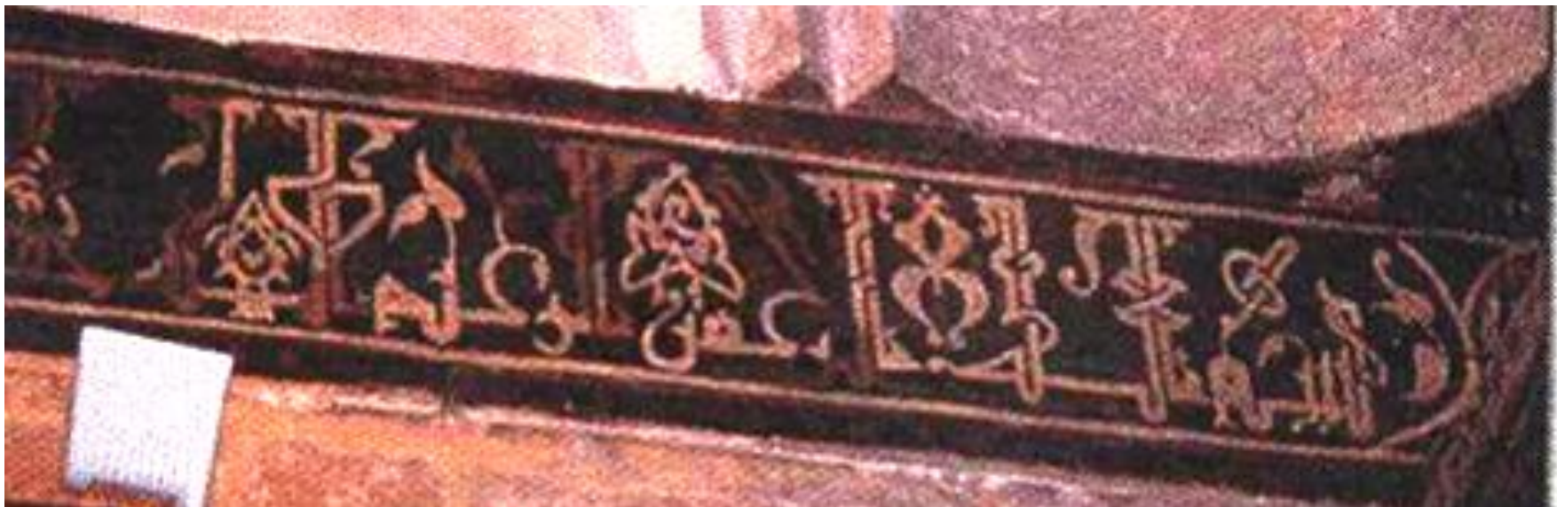
النقوش الكتابية الكوفية الموجودة داخل قبة الصالح نجم الدين أيوب.