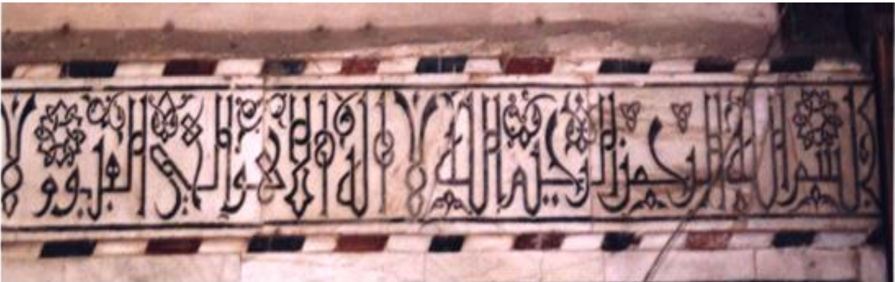
جزء من النقوش الكتابية الكوفية الموجودة بمسجد سليمان باشا الخادم.