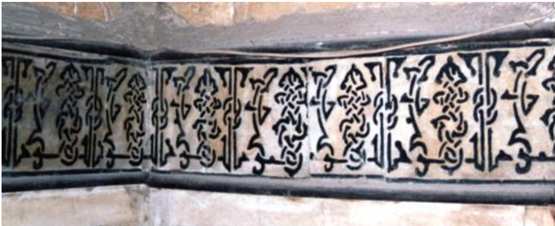
النقوش الكتابية الكوفية الموجودة بمسجد ومدرسة جوهر اللالا.