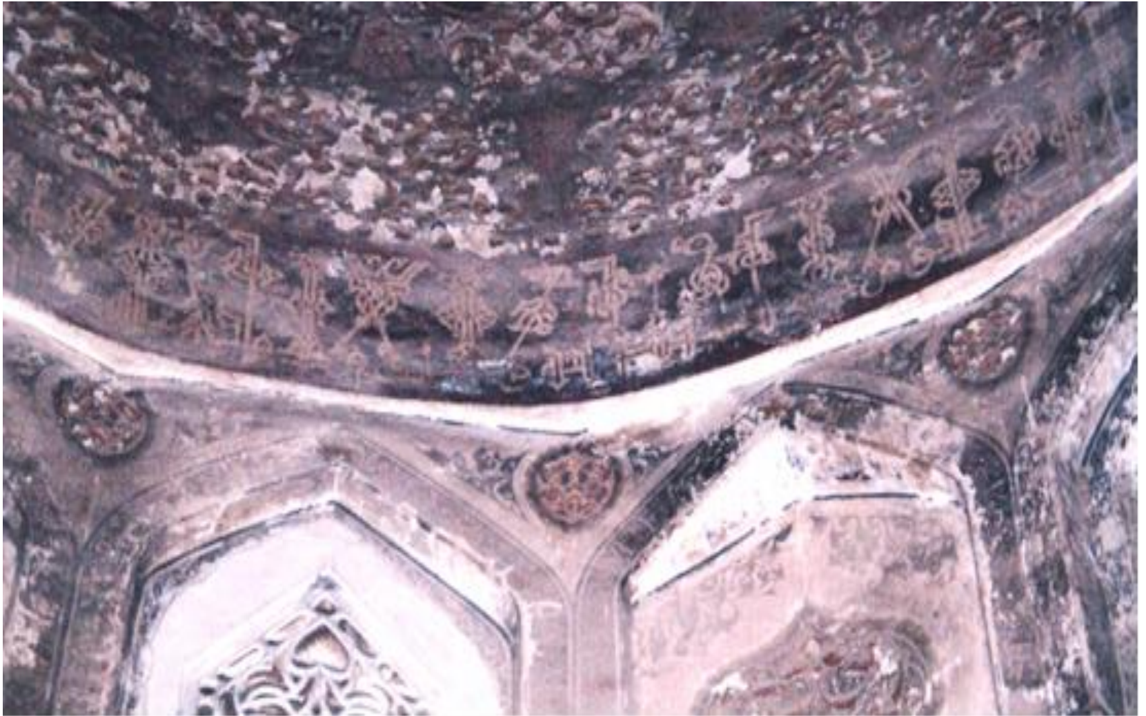
تفصيل للنقوش الكتابية الكوفية الموجودة بباطن قبة الخلفاء العباسيين.