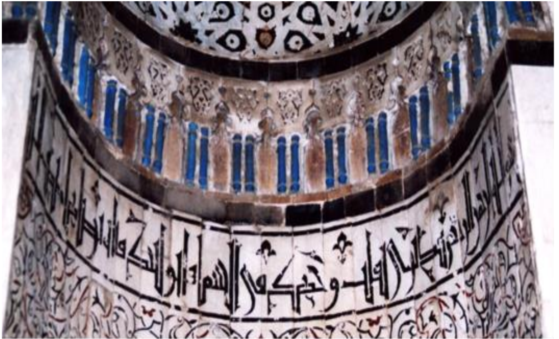
تفصيل للنقوش الكتابية الكوفية الموجودة بداخل محراب مسجد قجماس الإسحافي.