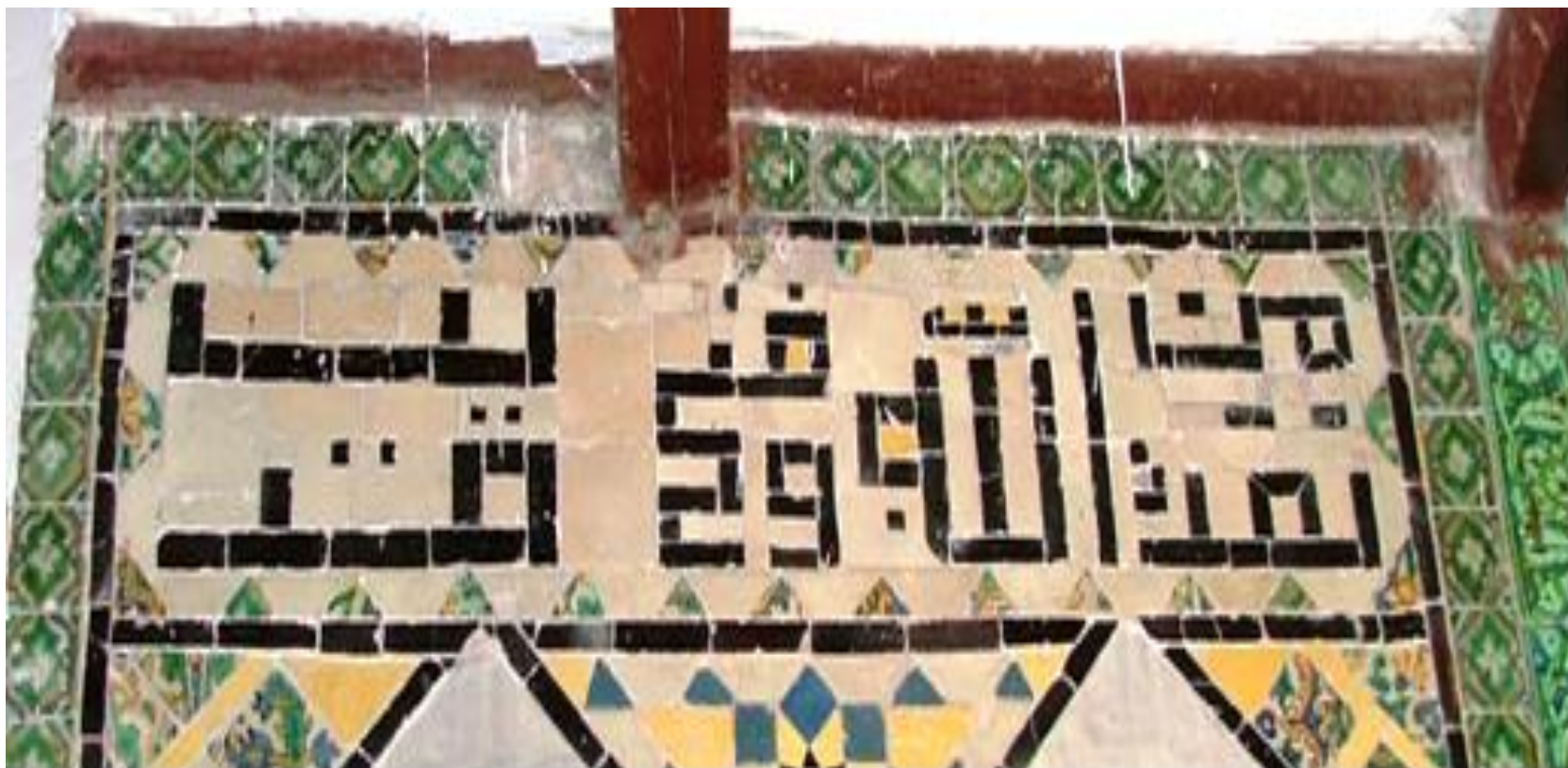
النقوش الكتابية الكوفية الموجودة بداخل جامع دومقسيس برشيد .