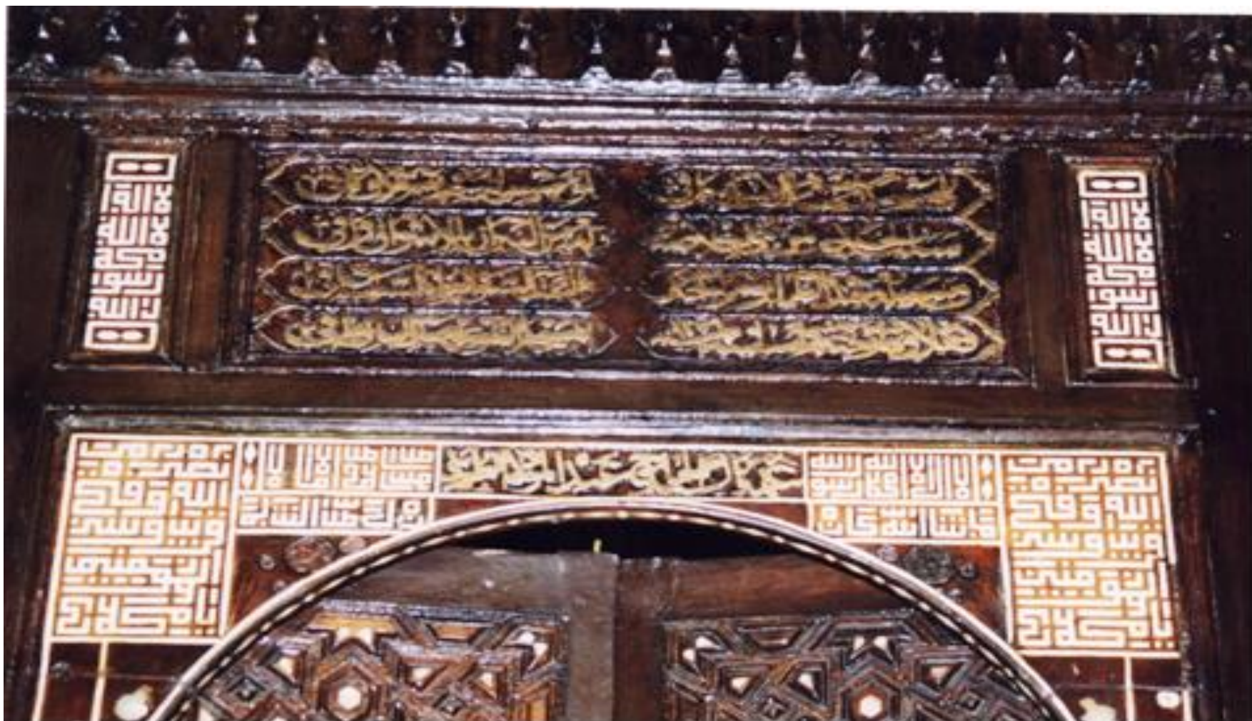
النقوش الكتابية الكوفية الموجودة على منبر مسجد عبد الباقي جوربجي.