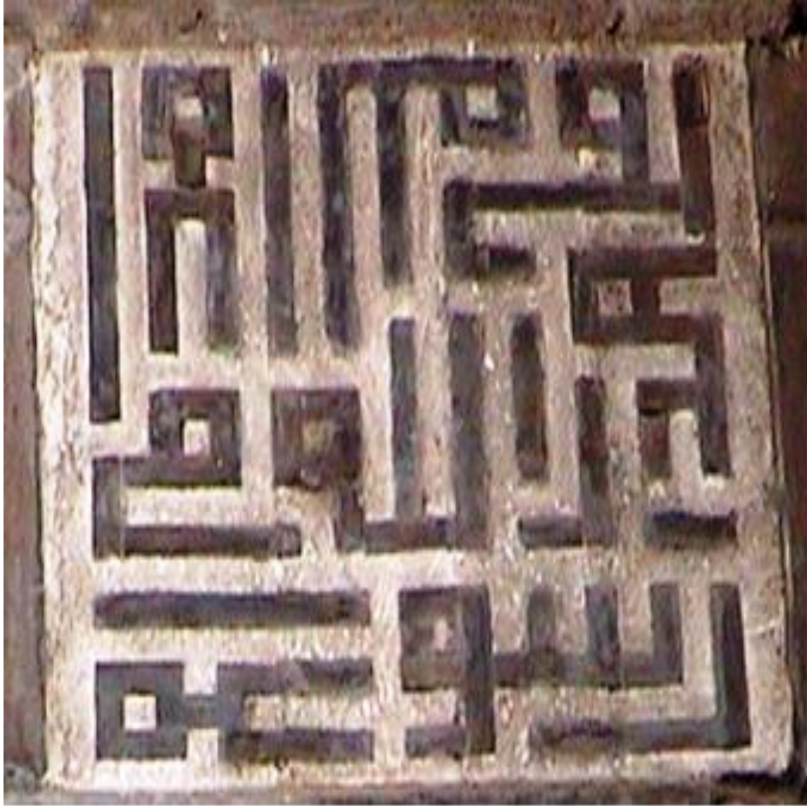
تفصيل للنقوش الكتابية الكوفية الموجودة أعلى مدخل مدرسة جمال الدين الاستادار .