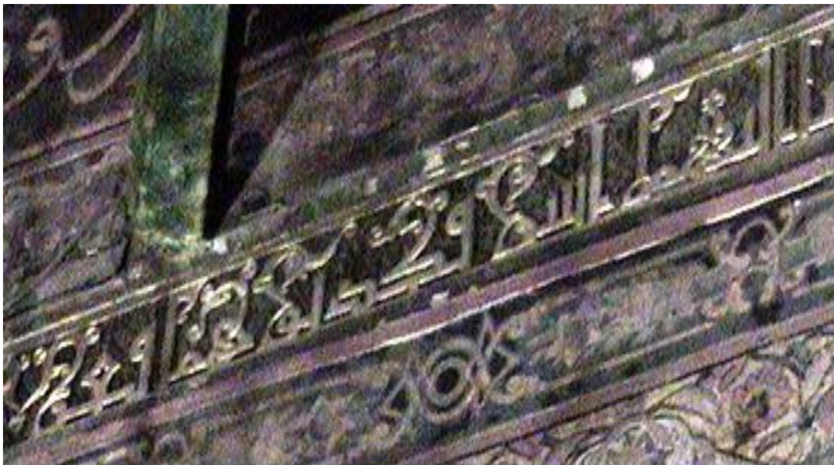
جزء من النقوش الكتابية الكوفية الموجودة بقبة الإمام الشافعي.